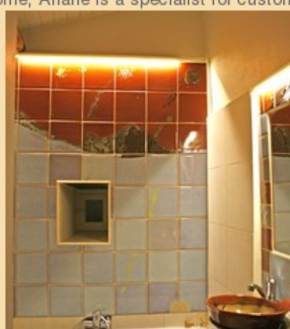
Bathroom tiling and washbasin

La Yourte rue des Balances – 34 000 Montpellier 04 67 66 29 46 - 06 71 35 43 20 expo December 10th to 25th 2014 opening reception December 11th 18h finishing reception December 20th 18h