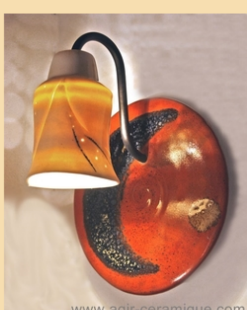
Porcelain mural lamp "Luna"