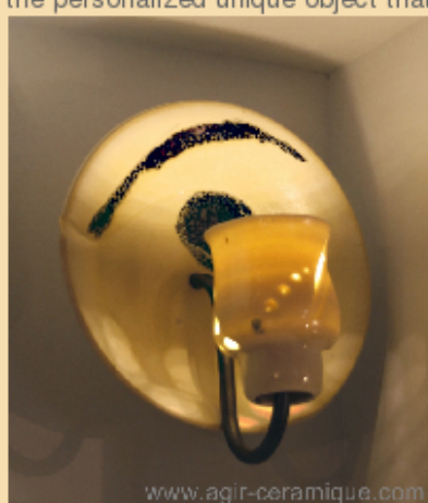
Mural lamp "Crépuscule"