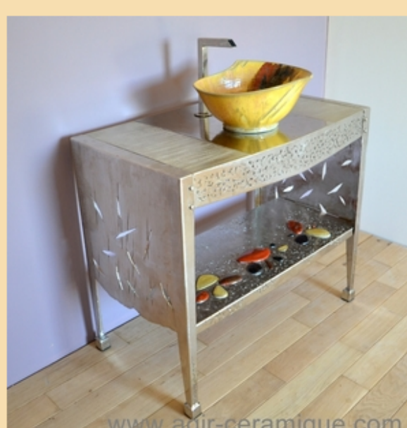
Washbasin with metal furniture: "Lotus"

A brand is being created ... to be continued!